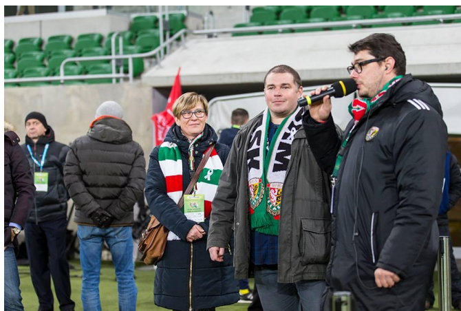
Biała Wstążka 2016 na meczu WKS Śląsk Wrocław - Legia Warszawa w dn. 27.11.2016

Podczas tegorocznej Kampanii liderzy grup roboczych zorganizowali wiele spotkań informacyjnych i edukacyjnych skierowanych do społeczności lokalnej, a także do członków grup roboczych. Uruchomiono przy Zespołach Terenowej Pracy Socjalnej oraz Zespole ds. Osób Bezdomnych i Uchodźców punkty informacyjne dla osób i rodzin dotkniętych problemem przemocy w rodzinie.