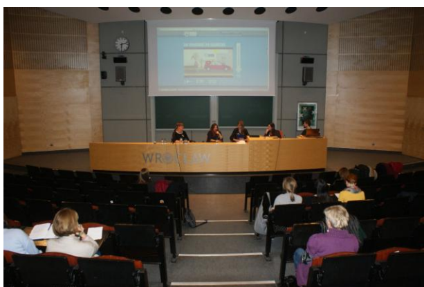
27.11.2015 - debata na temat przeciwdziałania przemocy w rodzinie.

W ramach przeprowadzonej Kampanii w dniach od 25.11.2015 r. do 10.12.2015 r. przeprowadzono szereg działań informujących społeczność lokalną o tym, że należy reagować na przemoc, w jaki sposób to czynić i do kogo się zgłosić. Czas Kampanii wykorzystano także do dyskusji nad przyczynami występowania przemocy, nad poszukiwaniem skutecznych rozwiązań przeciwdziałania przemocy. W dyskusji brali udział nie tylko przedstawiciele społeczności lokalnej, ale także przedstawiciele instytucji zobowiązanych do realizacji procedury „Niebieskie Karty” oraz organizacji pozarządowych.