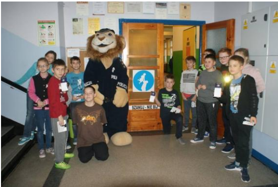
Szkoła Podstawowa 93.

Tabliczki umieszczane były także podczas tegorocznej Białej Wstążki. Hasła i grafiki przeciwko przemocy wobec dzieci zagościły w szkołach, instytucjach i Sądach.