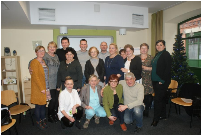
Część ekipy liderów grup roboczych w towarzystwie prowadzących superwizję.

Dyrekcja Miejskiego Ośrodka Pomocy Społecznej we Wrocławiu, mając na uwadze trudną pracę liderów grup roboczych, zadbała o to, by częściowo ograniczyć pracownikom socjalnym pełniącym tę funkcję, liczbę środowisk objętych pomocą Ośrodka w ich terenie, a także zapewniła szkolenia, warsztaty i superwizję kierowane do liderów grup roboczych.