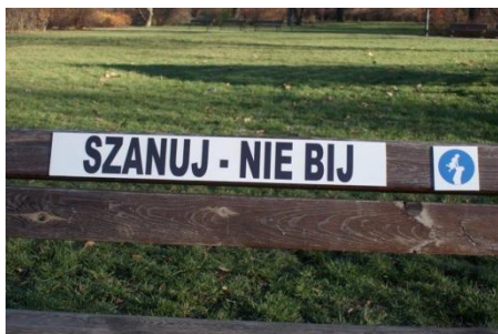
Plac zabaw w Parku Staszica.

Działaniami, które powtórzyły się w obu Kampaniach było umieszczanie tabliczek z hasłami przeciwko przemocy wobec dzieci. Tabliczki powstały w wyniku apelu mieszkanki Wrocławia, która obserwowała przemoc wobec dzieci na placu zabaw. Pomysły na hasła zapisane na tabliczkach były inicjatywą liderów grup roboczych. I tak w 2015 r. tabliczki zostały umieszczone na dwóch wrocławskich placach zabaw: przy ul. Krasińskiego oraz w Parku Staszica.