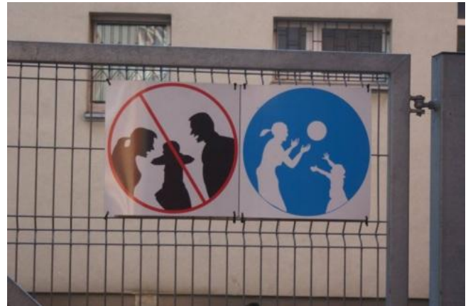
Nadodrzańskie Centrum Wsparcia.

Podczas obu Kampanii liderów grup roboczych wsparły nie tylko instytucje wchodzące w skład Zespołu Interdyscyplinarnego, takie jak m.in. Komenda Miejska Policji, Sądy Rejonowe, Miejski Ośrodek Pomocy Społecznej, ale także organizacje pozarządowe i kluby sportowe.