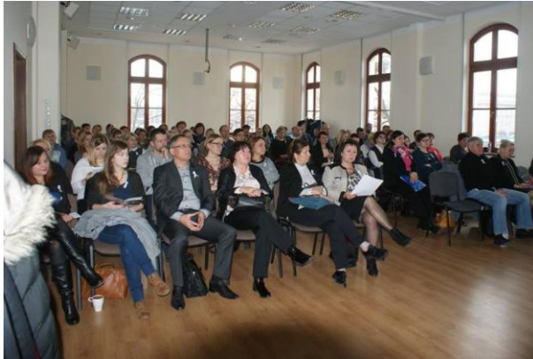
25.11.2015 - konferencja inauguracyjna Białą Wstążką 2015.

Kampania rozpoczęła się uroczystą konferencją przygotowaną przez liderów grup roboczych przy współpracy z Centrum Integracji Społecznej. Przygotowania do tego wydarzenia trwały kilka miesięcy. Efektem tej współpracy było spotkanie w którym uczestniczyło ponad 80 osób, a także broszura informacyjna dla osób doznających przemocy.